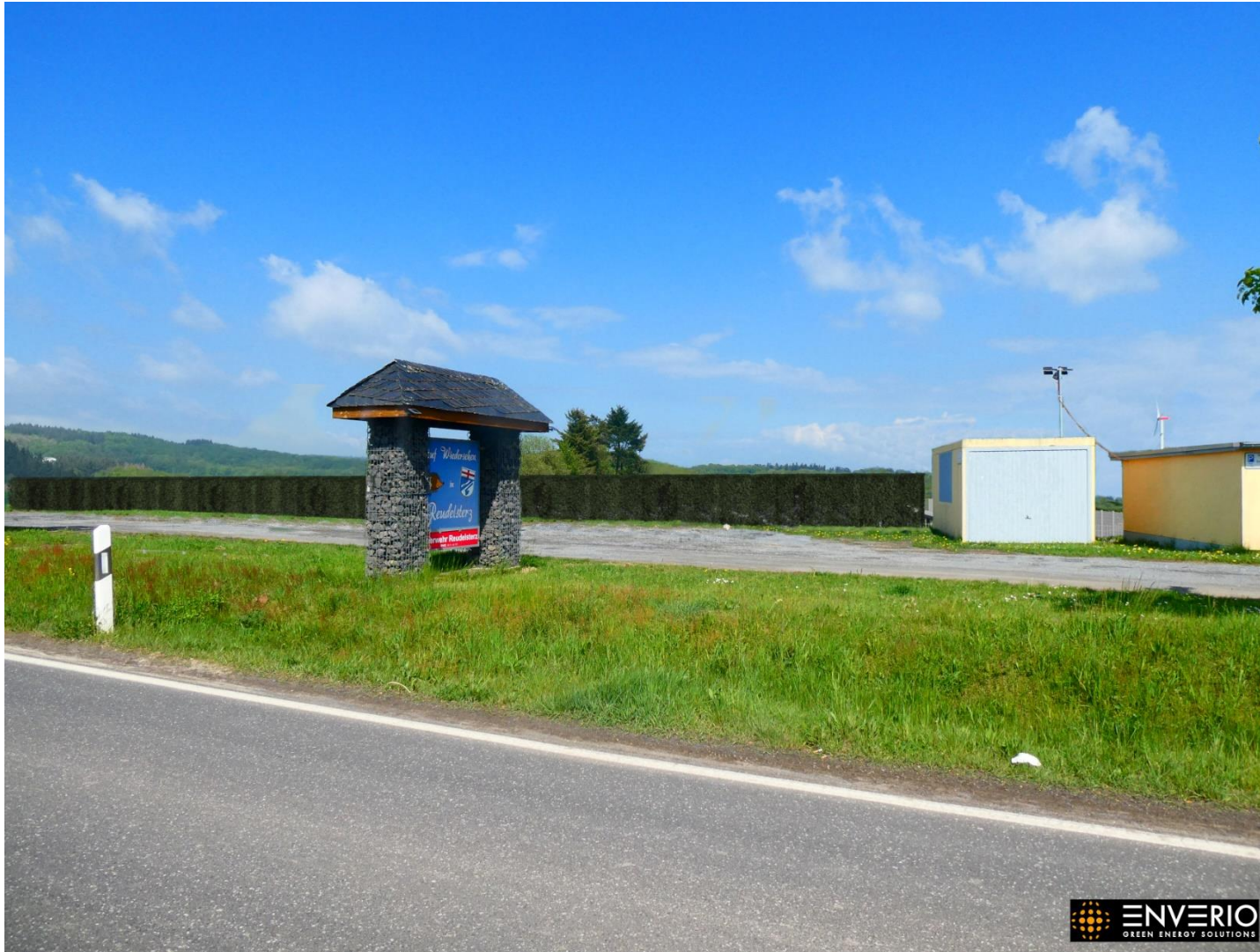
Abb. 5: Blick auf die zukünftig Solarparkfläche von der Kürrenberger Straße aus Richtung Osten blickend