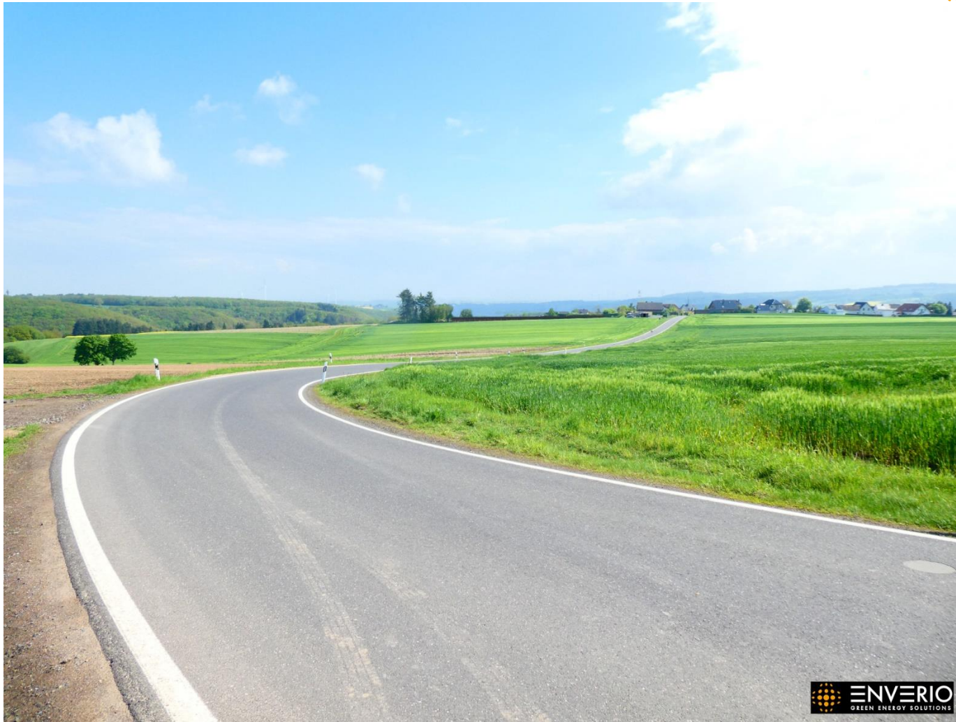
Abb. 7: Blick auf die zukünftige Solarparkfläche und Reudelsterz außerhalb der Gemeinde nach Süden blickend