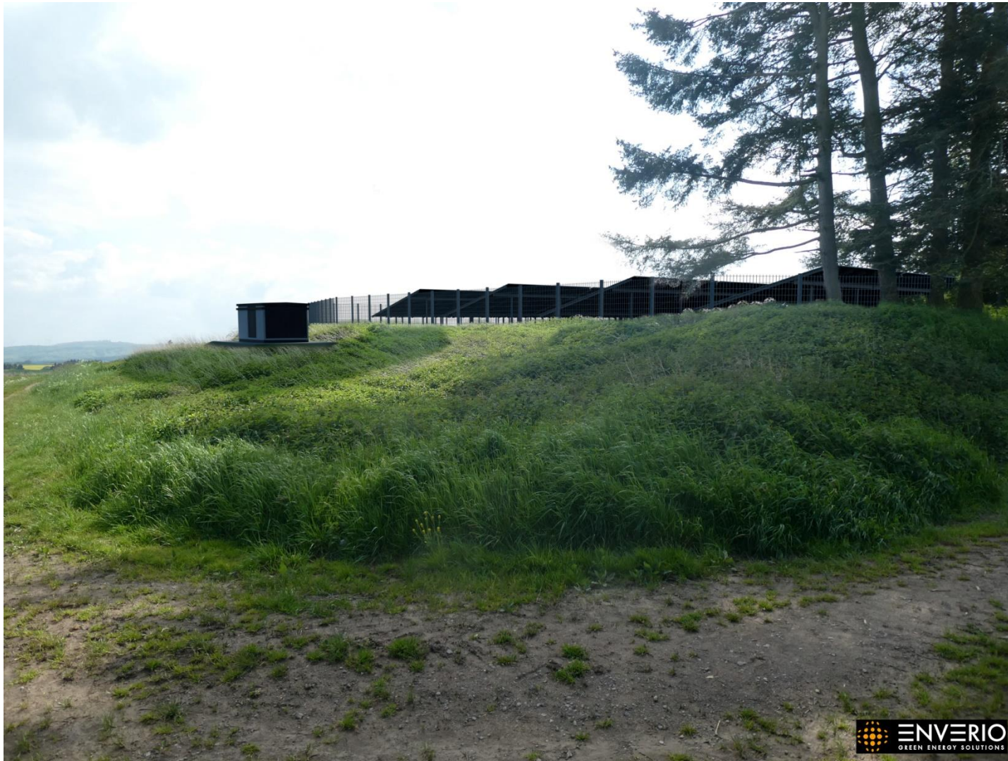
Abb. 2: Blick auf die zukünftige Solarparkfläche und Kombistation des nordöstlichen Eckbereichs Richtung Südwesten blickend