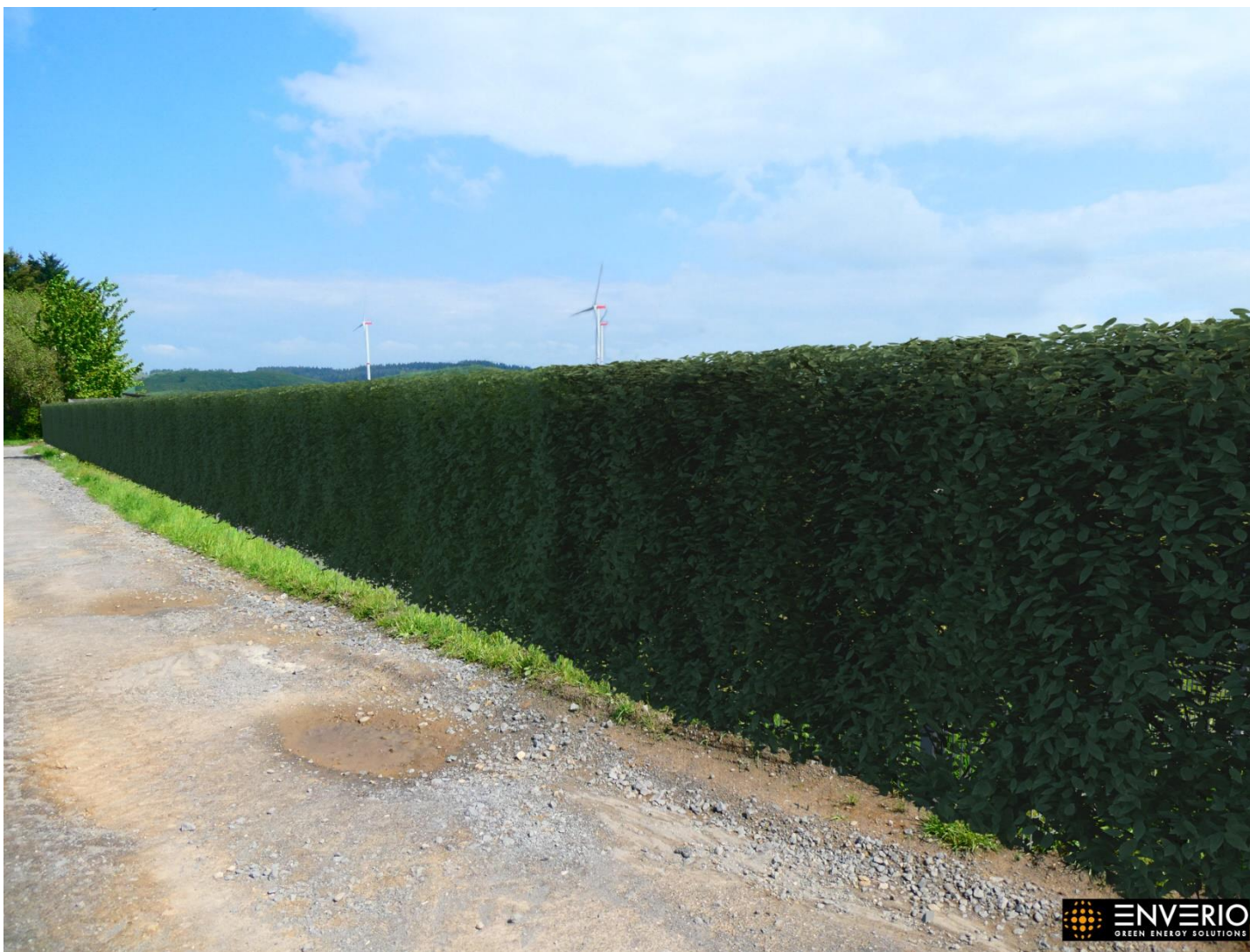
Abb. 1: Blick auf die zukünftige Solarparkfläche des nordwestlichen Eckbereichs Richtung Osten blickend