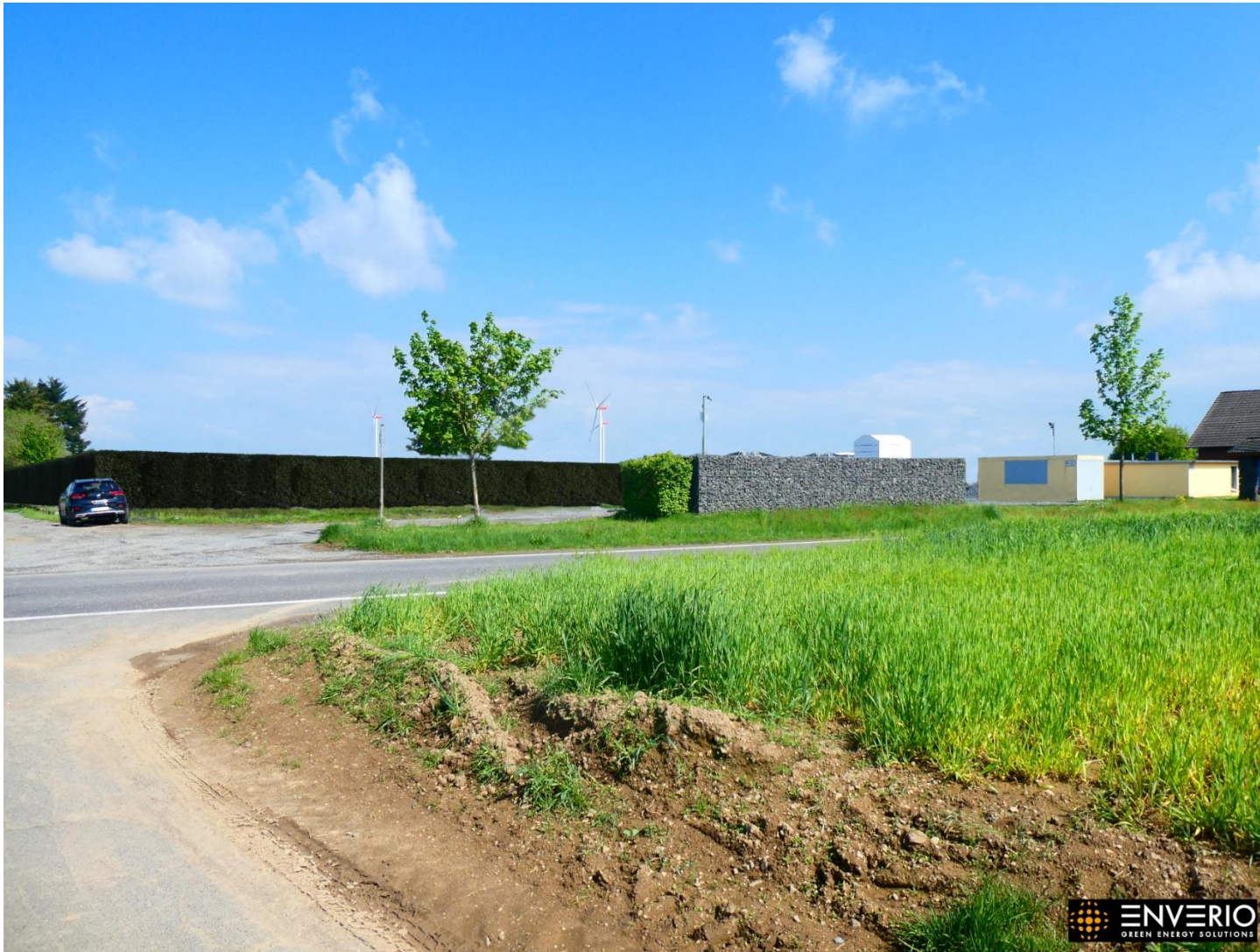
Abb. 6: Blick auf die zukünftige Solarparkfläche von westlicher Seite der Kürrenberger Straße blickend